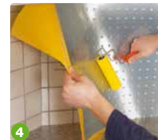
4 aufkleben - fertig