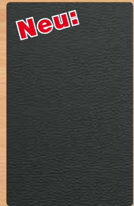
▲ Leder schwarz Lederoptik geprägt Reliefhöhe ca. 2,1 mm