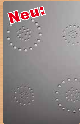
▲ 3D Diamonds silber / grau Folienprägung silber Reliefhöhe ca. 1,3 mm