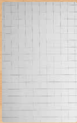
▲ Spiegel flex silber reflektierend / biegsam eingeschnitten