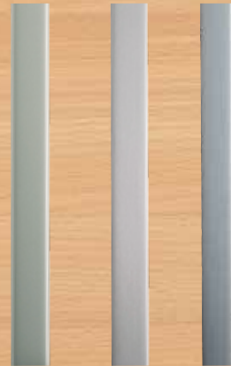
▲ Profile silber glänzend silber gebürstet oder Edelhstahloptik 1060 x 22 mm selbstklebend