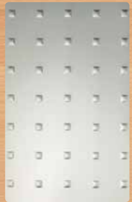
▲ Quadrate geprägt Edelhstahloptik gebürstet / geprägt Reliefhöhe ca. 1,9 mm