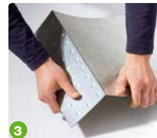
3 knicken - brechen