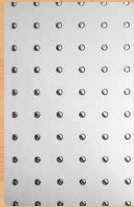
▲ Kreise 3D silber gebürstet Folienprägung silber