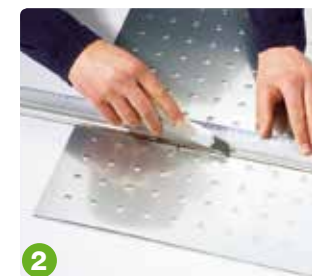
2 von oben einschneiden