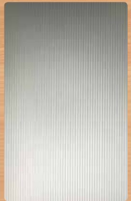
▲ Kleinwelle Edelhstahloptik gebürstet / geprägt Reliefhöhe ca. 1,2 mm