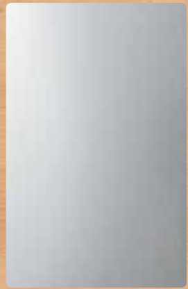
▲ Flach silber gebürstet

unser Sortiment umfasst eine große Anzahl an hochwertigen Oberflächen