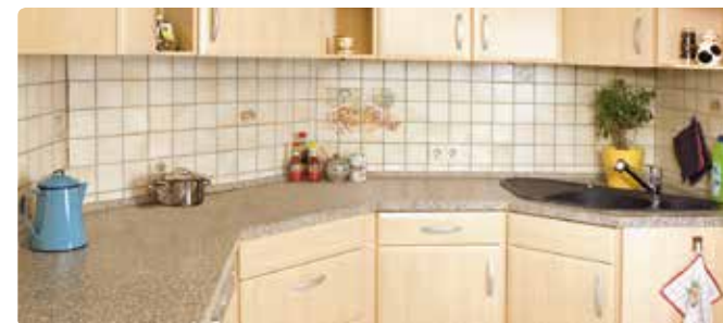
↑ vorher / nachher ↓